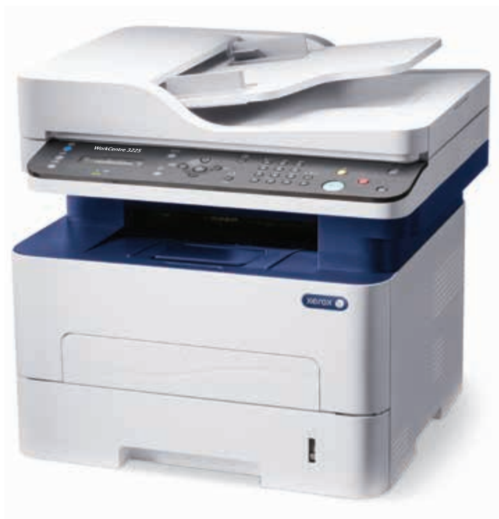
WorkCentre 3225. Copiado. Impresión. Escaneado. Fax. Correo electrónico.